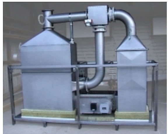
Katalytische Nachverbrennung KNV