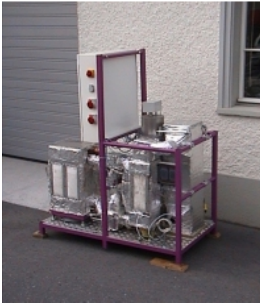
Mobile ConCat Pilotanlage für Versuche vor Ort